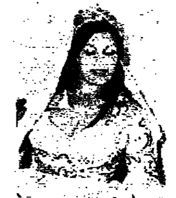
«أينا» .. رقص يوناني

بيروت وصومالية بدأت بيروت تستخدم ليلاً .. شارع الحمراء الذي قد ليله فترة عابت إليه اغواءه ، وعاد إليه رواده خاصة هرة ماغي الرصعة .. واللاهى الليلية أو بقاياها ما زالت تصارع لتضيق نفسها مكتابة الاستمرار. وفي جولة ليالية تركزت على منقني الحمراء والروشة بسدا واضحا ان هناك محاولات صادقة يقوم بها اصحاب المؤسسات لامتداد الحياة الطبيعية اليها .. المبارات الصغرى معطفا اقل ابوابها والاسباب عديدة لا مجال لتفحصها الا ان ، اما اللامبي التي تقدم برامج غنائية ورصاصة ، فلها نصيب في صراعها محاولة الصعود في مواجهة خسائر كبيرة يسببها لها خلوص بيروت تقريبا من السياح الغرب والاجانب على السواء . ومع ذلك تبتعث الموسيقى كل ليلة في هذه الاماكن ، وتظهر الرقصات والمخربات والمخربون في الطيبة ، ويتم البرنامج للفتاة الموجودة في الصالة . ونسل احد اصحاب هذه الاماكن عن الحالة ، فيجيب : الحالة كما ترى .. عدد محدود من الزمان وخسارة يومية ، ولكن رغبتنا ان نسمع .. اننا نرى في الاتي ما يشجع .. ولم يفتقر حوادث والحمد لله ، وقد اخذ